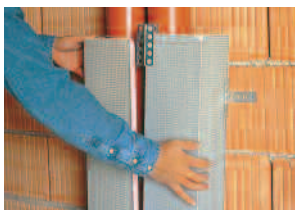
Austrotherm Uniplatte® L-Winkel

Die Austrotherm UNIPLATTE® L-/U-Winkel sind raumhohe Fertigelemente. Sie erleichtern die sonst kosten- und zeitintensive Herstellung von senkrechten und waagrechten Rohrverkleidungen wesentlich. Aufwändiges Mauern & Verputzen oder Unterkonstruktionen gehören der Vergangenheit an. Den L-/ oder U-Winkel schneidet man lediglich mit einer Säge zu und montiert ihn im Zuge der Fliesenarbeiten.