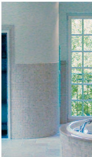
Raumhohe runde Verkleidung mit Austrotherm UNIPLATTE® Flexibel