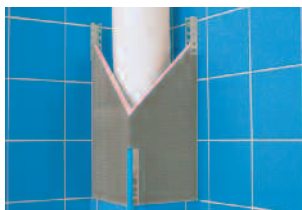
Austrotherm Uniplatte® U-Winkel