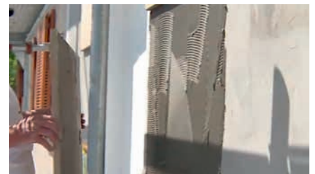
Auch der Untergrund wird vollflächig mit normgerechtem Fassadenkleber versehen.