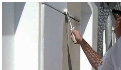
Nun wird die komplette Fläche grundiert.