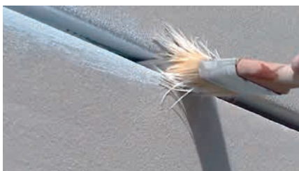
Herausquellende Klebespachtelmasse wird mit einem nassen Pinsel zu einer Hohlkehle geformt.