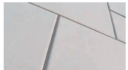
Danach kann die entsprechende Oberflächenfarbe im Rollverfahren dünnsschichtig aufgetragen werden.