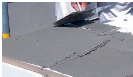
Das Austrotherm Designelement wird vollflächig mittels Zahnspatel mit normgerechtem Fassadenkleber versehen.